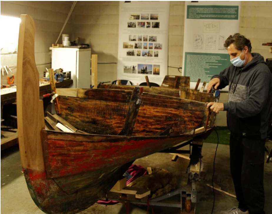
Un miembro de la entidad restaurando uno de los barcos | gonzalo salgado