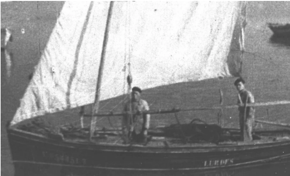
La única foto hallada de una gamela de Cambados en navegación | cofradía