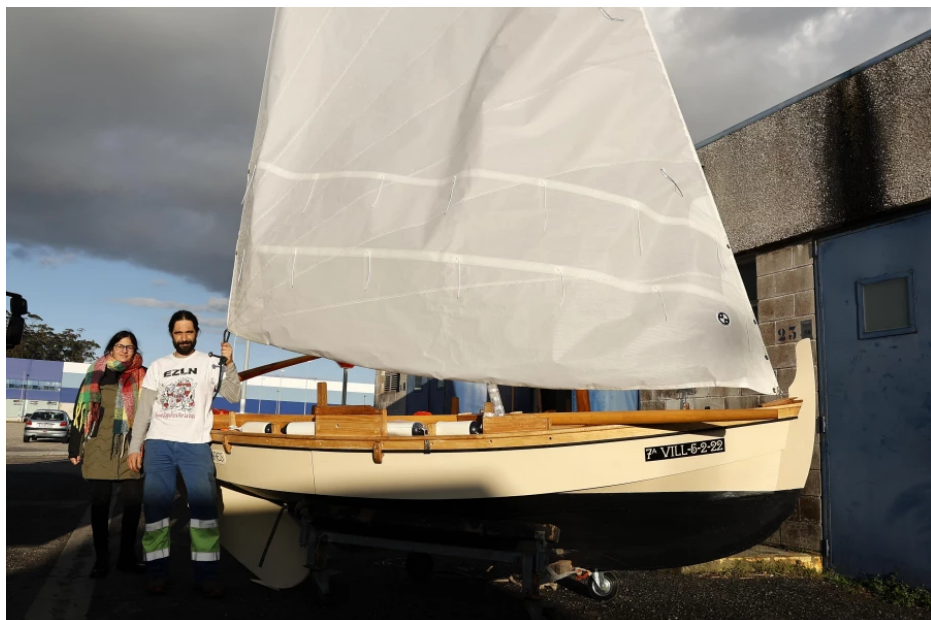
Membros do Clube Mariño Salnés ante a dorna polbeira “Águila Tres” trala súa restauración | Gonzalo Salgado