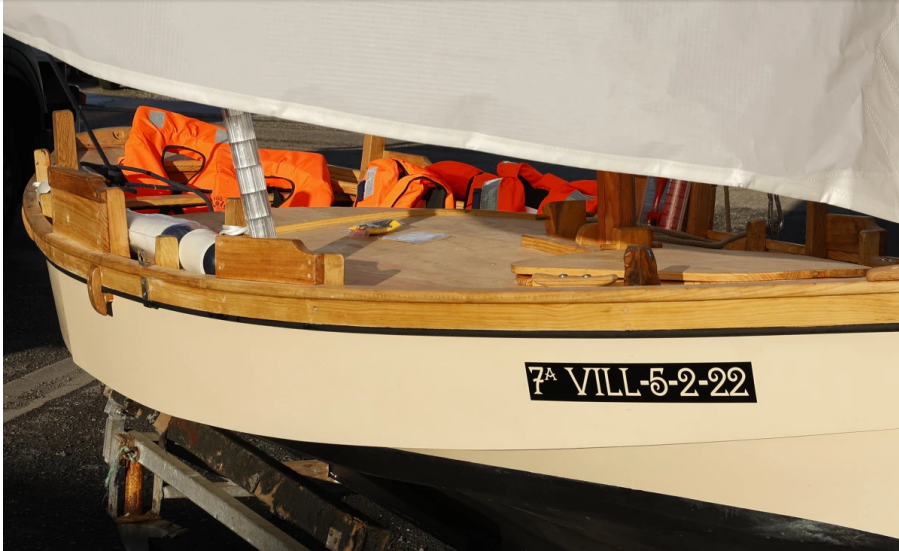
Detalle da dorna polbeira Águila Tres restaurada polo Clube Mariño Salnés | Gonzalo Salgado