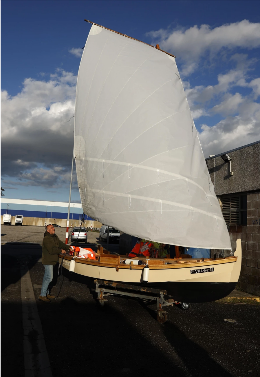
Vista completa da dorna restaurada polo clube de Cambados de navegación e conservación do patrimonio marítimo tradicional

Toda a operación, incluíndo o equipamento, tivo un coste de 11.706 euros; unha cantidade importante para unha entidade que sobrevive coas cuotas dos socios e que puido asumir porque a subvención provincial cubriu o 80 %. A Escola de Vela Tradicional de Cambados tamén conseguiu unha axuda desta liña para a recuperación e posta en valor do patrimonio marítimo que lle permitirá renovar a vela da súa dorna “festivaleira”, a “Julicheira”.