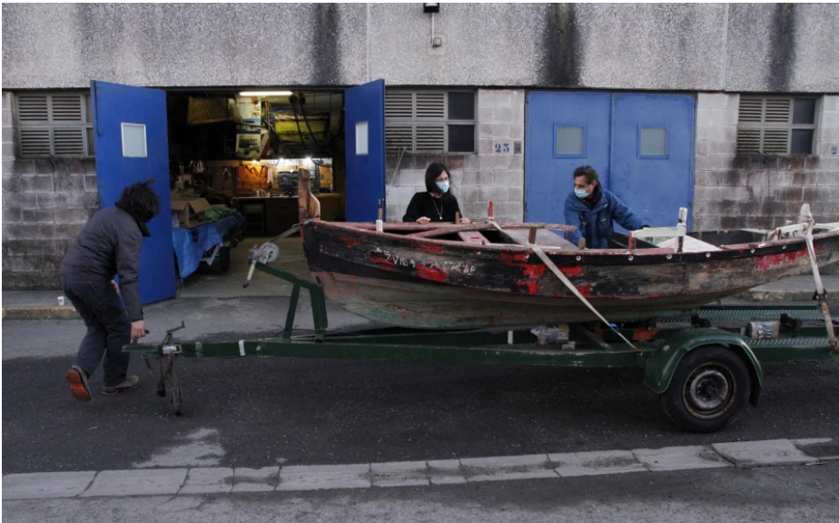
Membros do Clube Mariño Salnés coa dorna doada nun dos seus talleres no porto de Tragove | gonzalo salgado