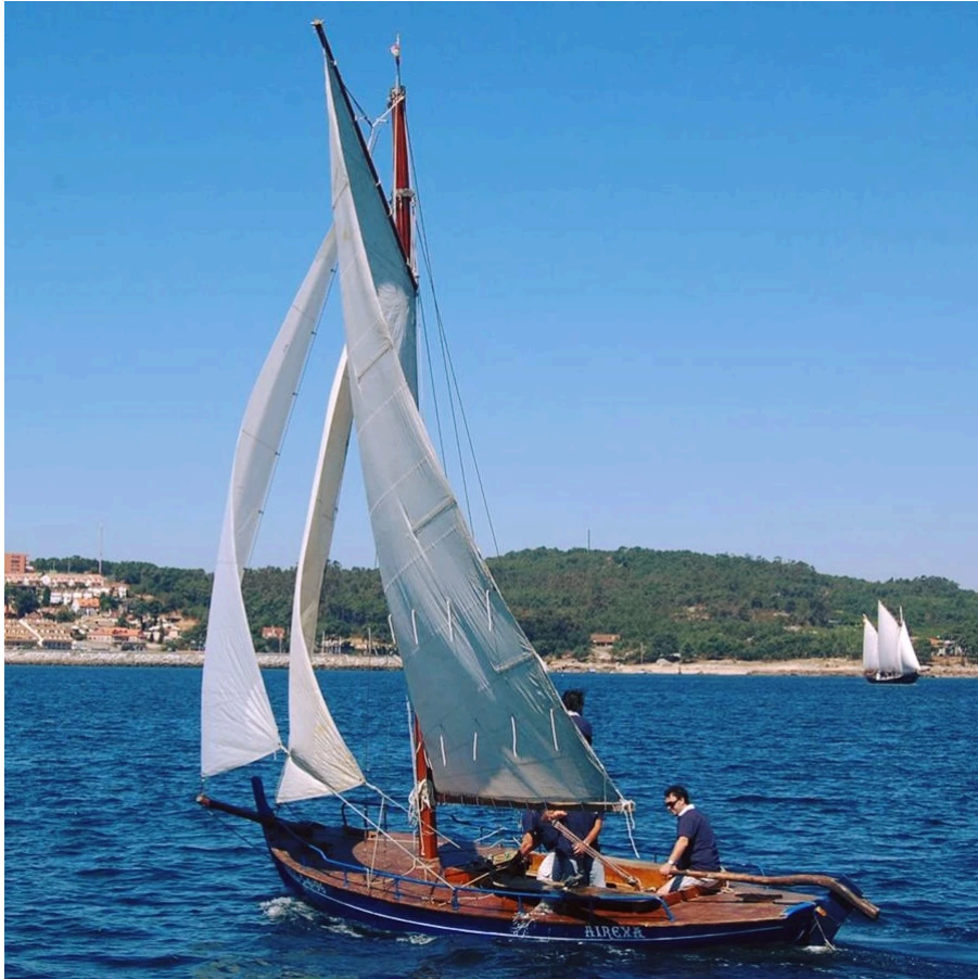
Vista de la Airexa en navegación