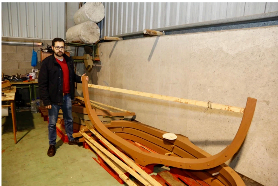
Un directivo del Clube Mariño Salnés con las cuadernas de la dorna | MÓNICA FERREIRÓS