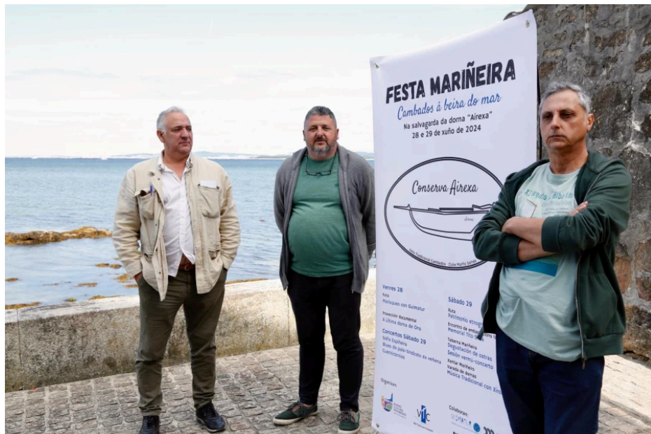
La presentación fue hoy, en la zona litoral | Mónica Ferreirós